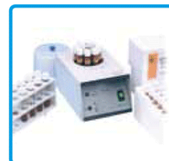
Termoreattore per analisi COD