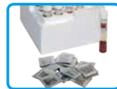
Bustine di reattivi Vario e provette per COD