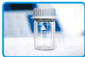
Vials per l'analisi del campione