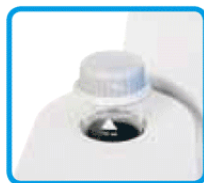
Vials con tappo a tenuta di luce