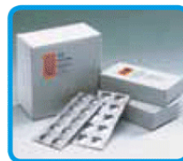
Compresse predosate in blister in alluminio