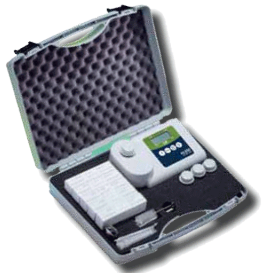
Fotometro con valigia di trasporto