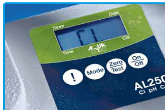
Particolare della tastiera a tenuta stagna